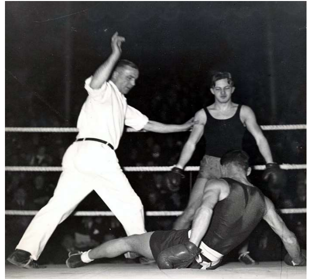
Dramatik under Junior-SM 1938