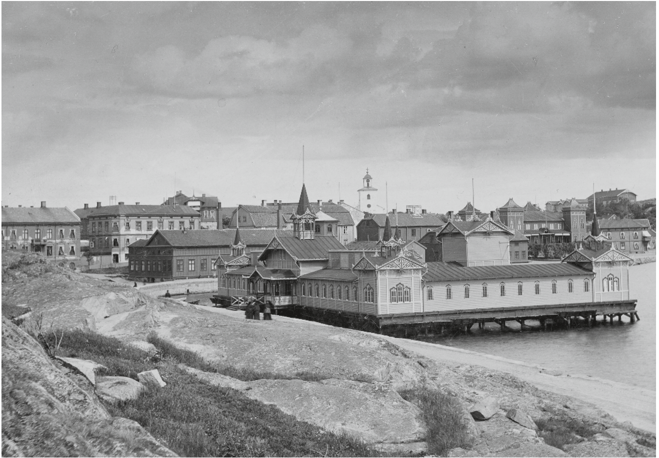
Kallbadhuset Strömstad 1880.