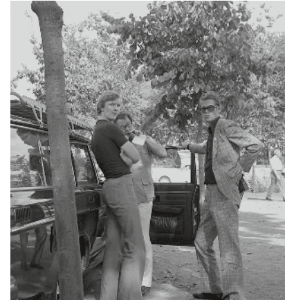
Skolminister Ingvar Karlsson på besök 1973.