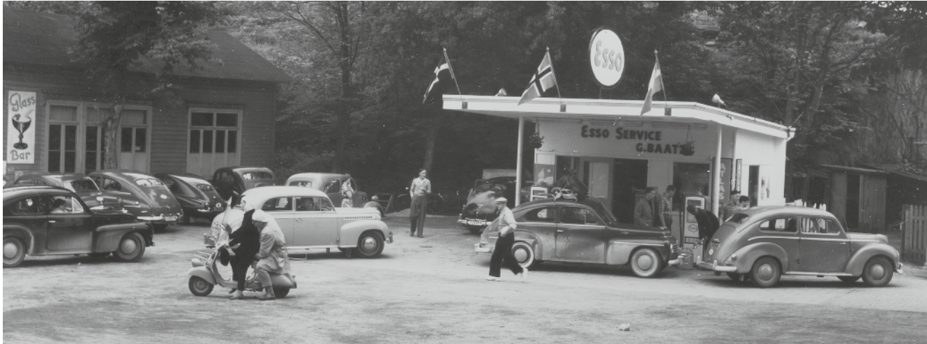
Kring 1960. Folkliv vid Trädgårdens hotell.