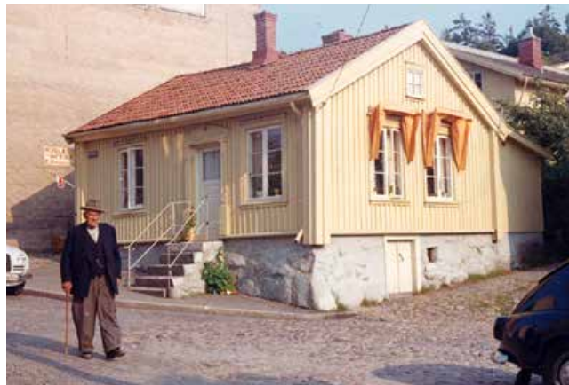
Mjölkkaffär. Bilden är tagen 1962, mjölkaffären låg vid Bukten.