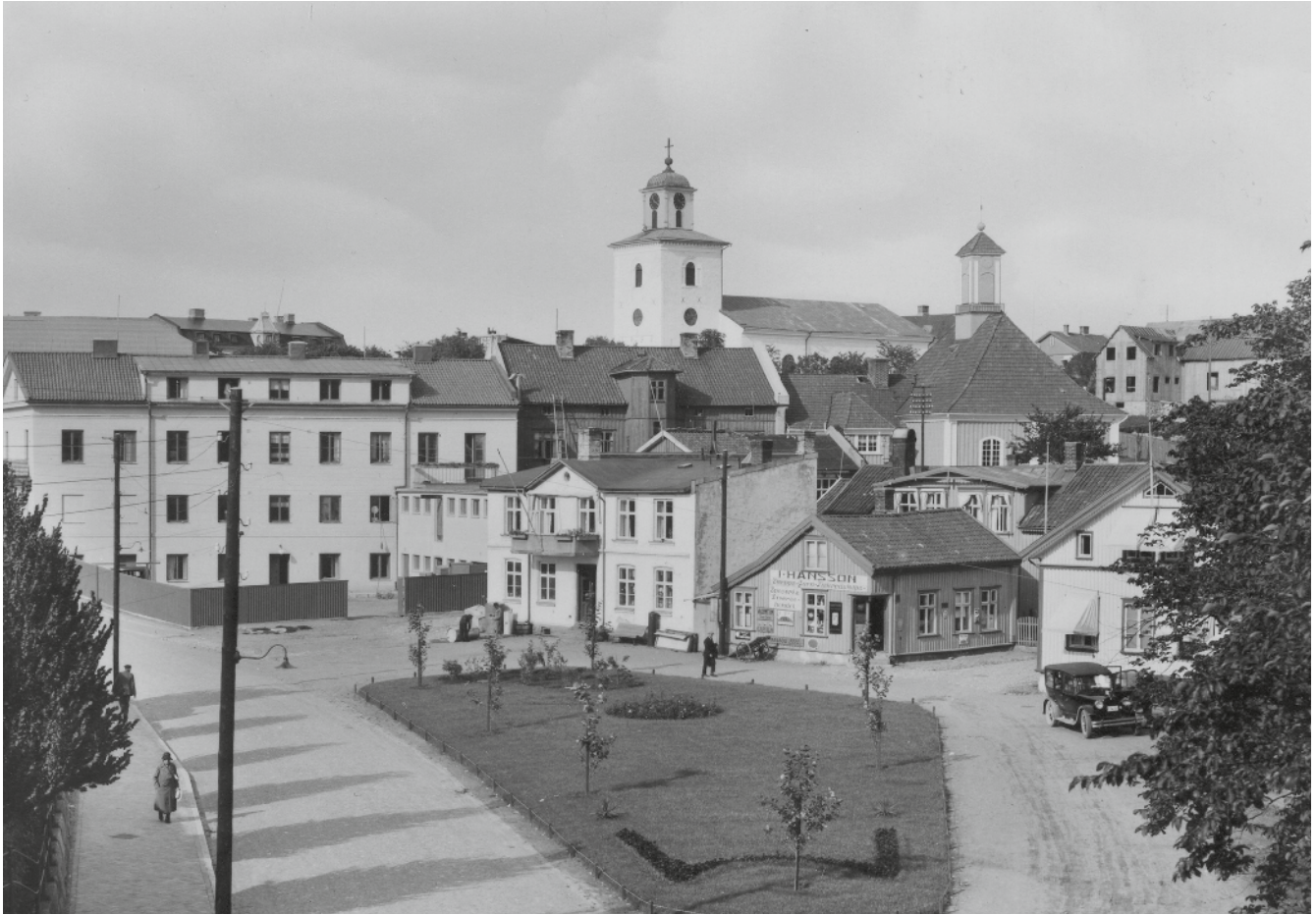
Strömstad 1930. Konsumhuset och huset där Swedbank är i dag är i slutfasen av bygget. Den gröna plätten kallades järnvägsparken.