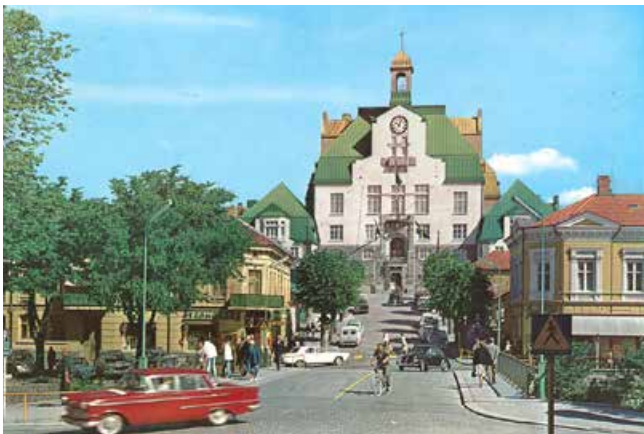
Vänstertrafik. Bilden är tagen åren före den historiska omläggningen till högertrafik i september 1967.