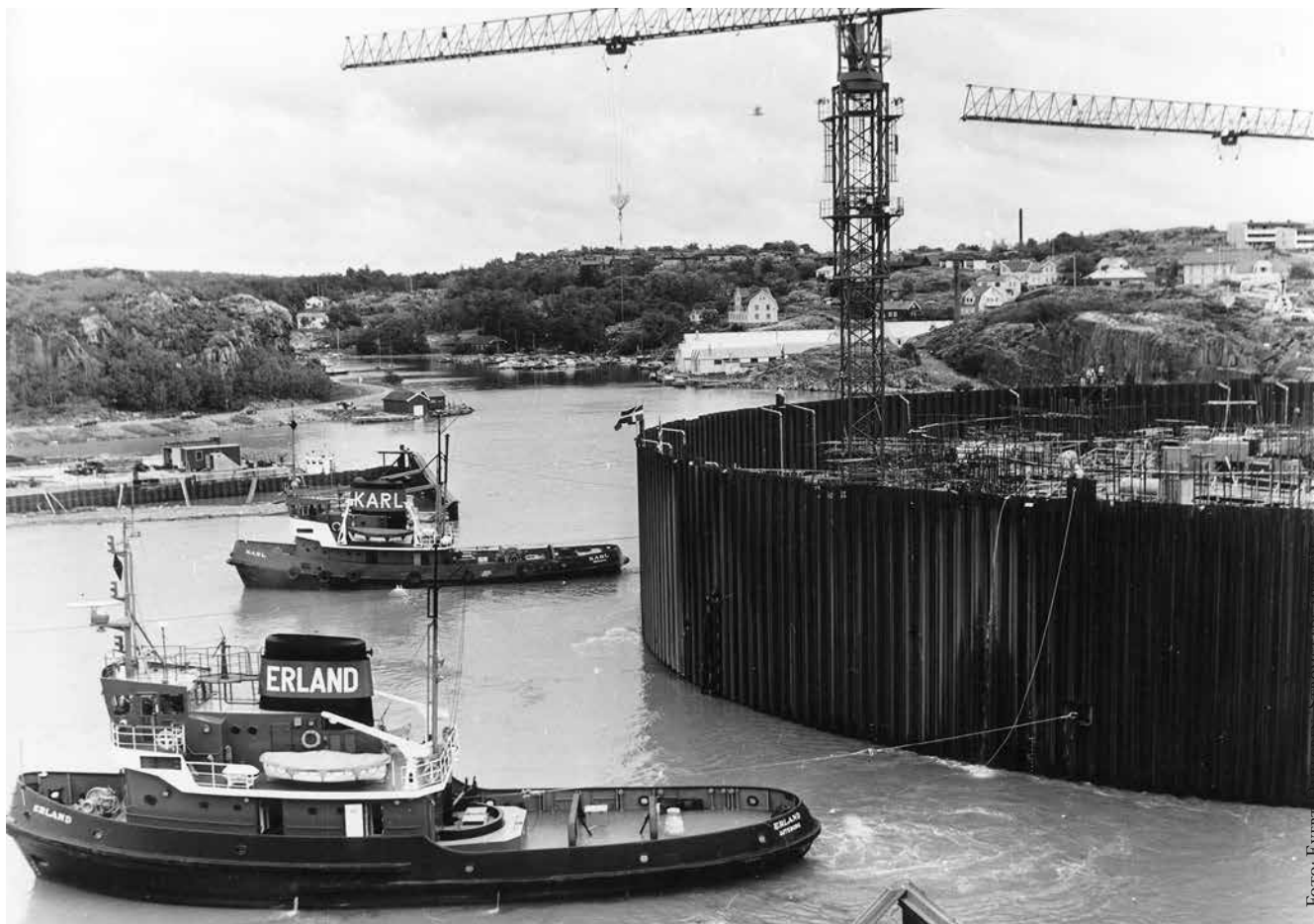
Plattformsbygget i Kebabviken.