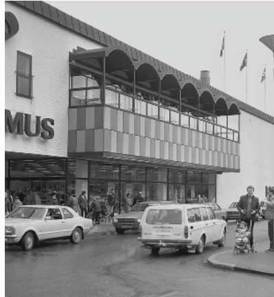
Nya Domushuset invigdes 1972.