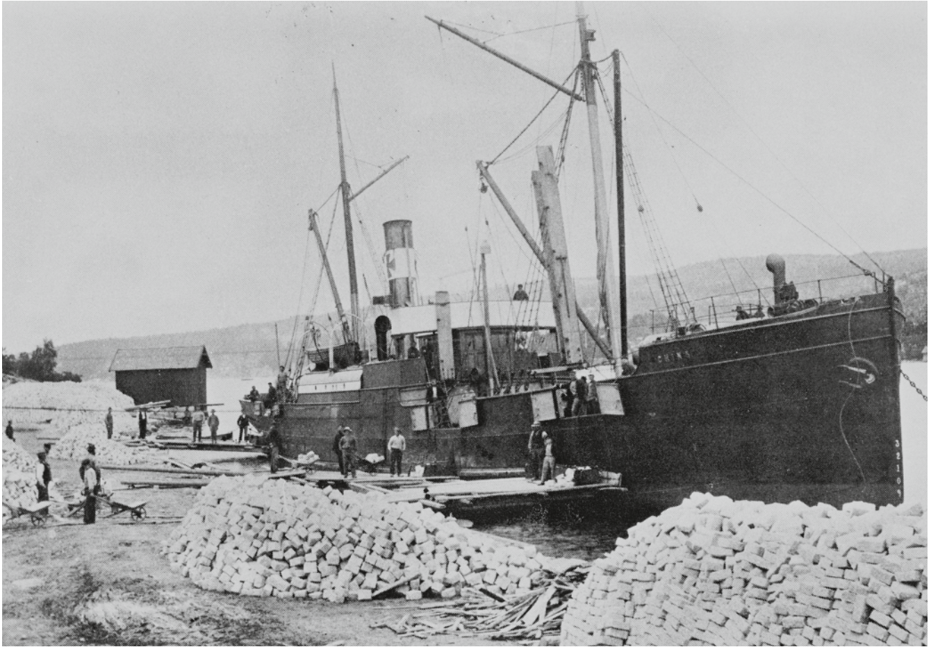
Krokstrands hamn. Lastning av sten 1902.