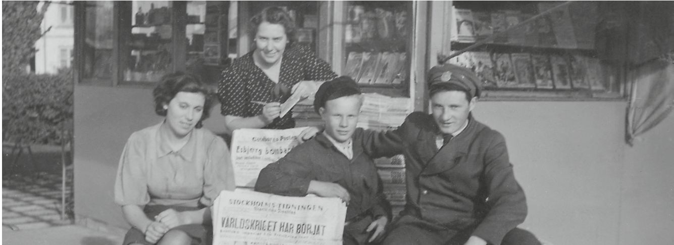
Krigsrubriker. Utanför tidningskiosk i Strömstad. Tidningsrubrikerna talar om att andra världskriget just brutit ut.