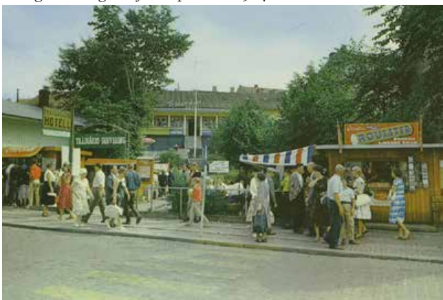
Kring 1960. Folkliv vid Trädgårdens hotell.