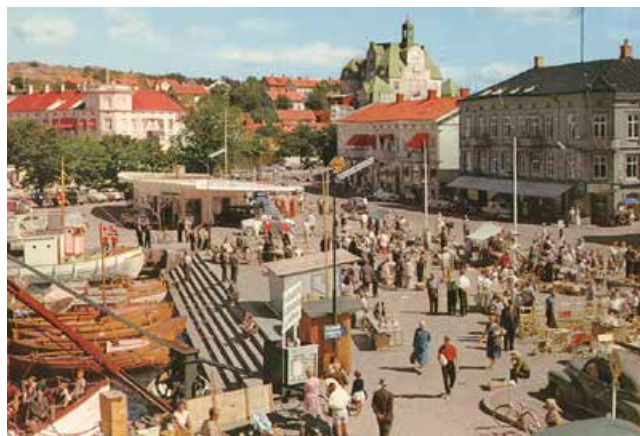
Torget en sommardag i mitten av 60-talet.