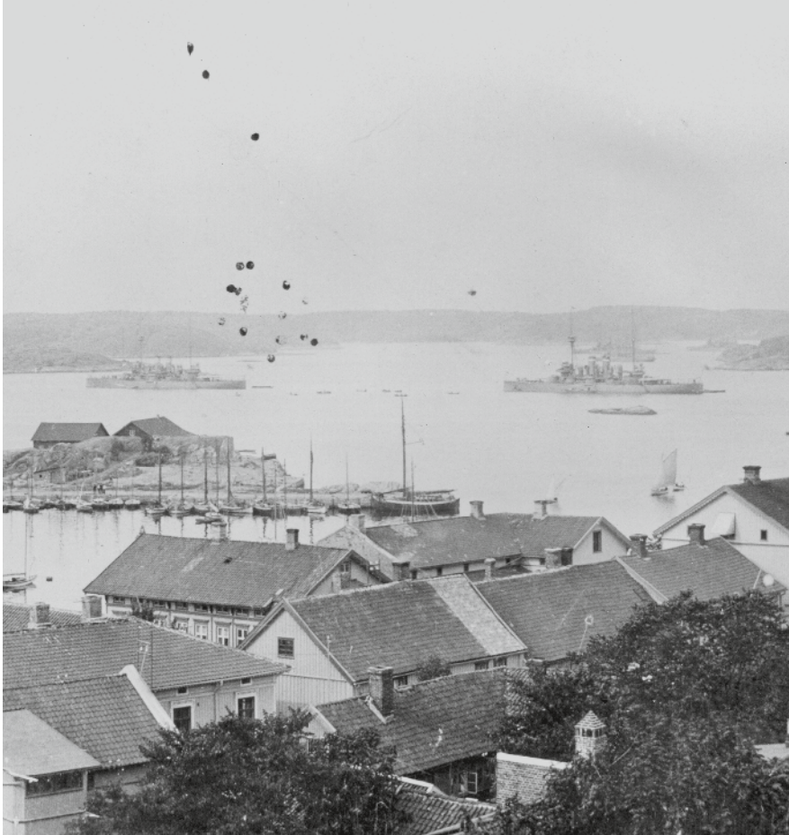
Utanför Strömstads hamn ligger svenska pansarkryssare 1905 i väntan på signalen om krig.