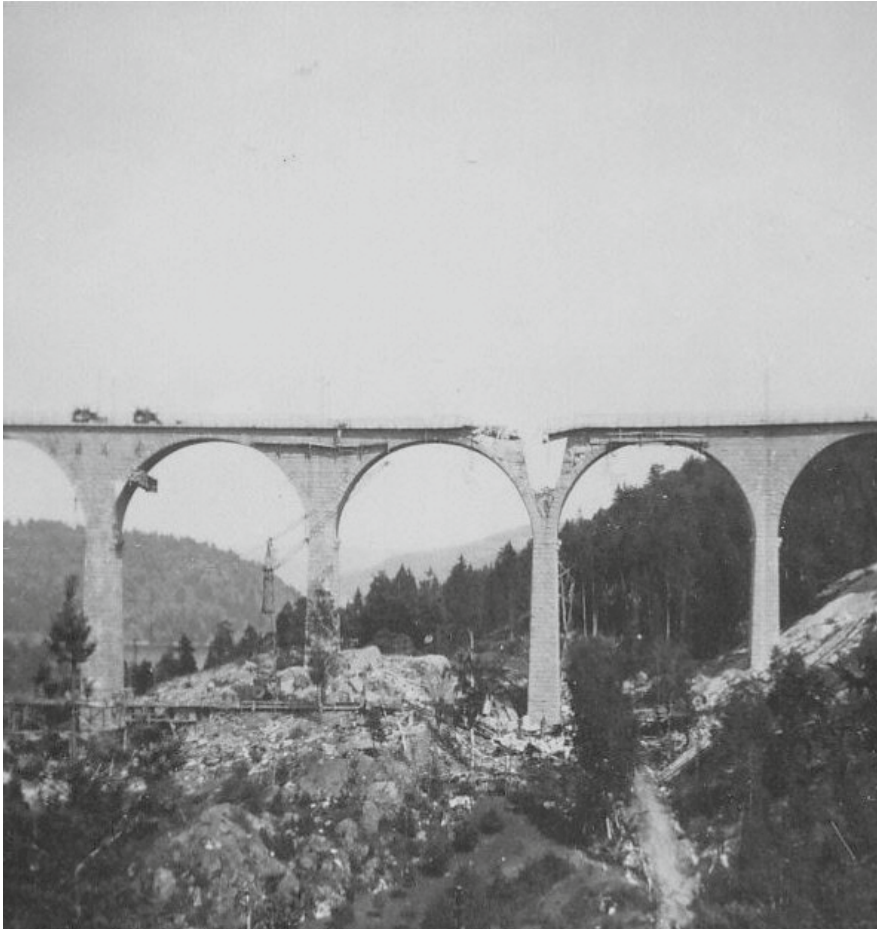
Gamla bron efter explosionen.