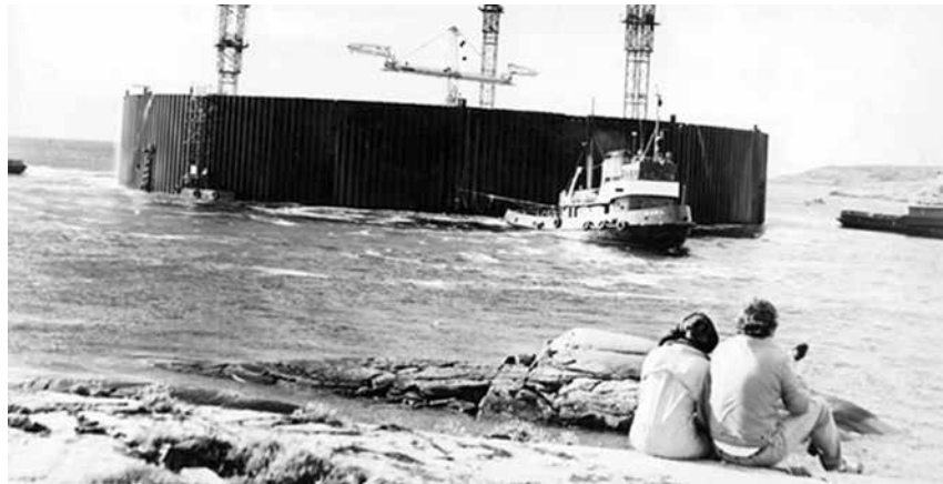
Den färdigbyggda plattformen bogseras iväg ut på havet.